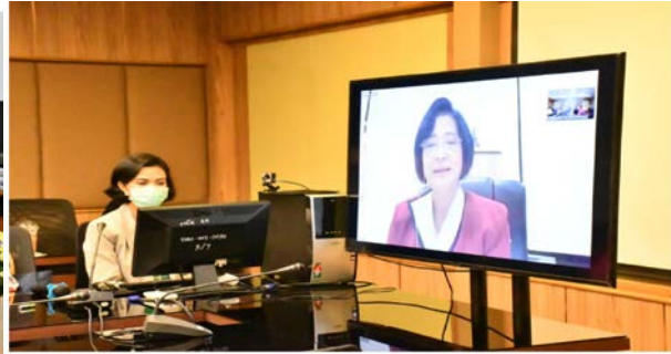
เรื่องเล่าเจ้าพลัง : ห้อง ๑