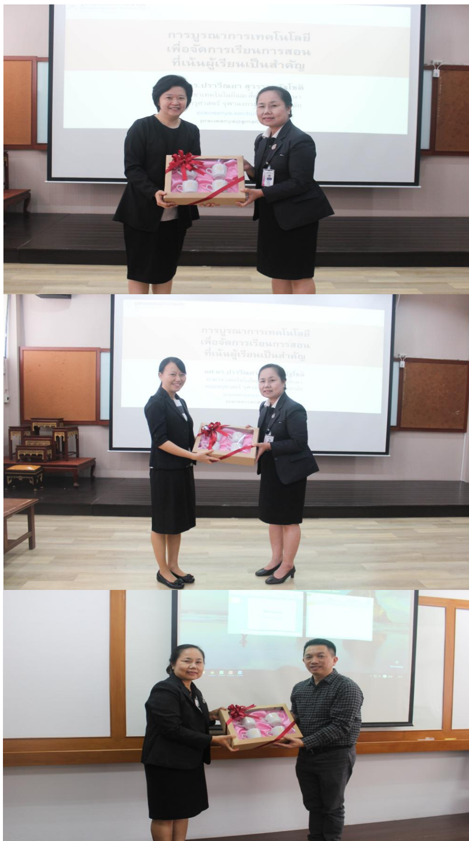
ทีมคณะวิทยากรระหว่างวันที่ ๑๒ - ๑๔ กรกฎาคม ๒๕๖๐